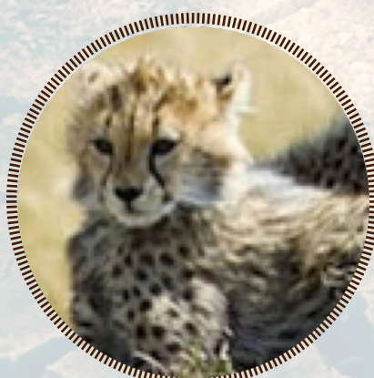
LE PETIT GUÉPARD